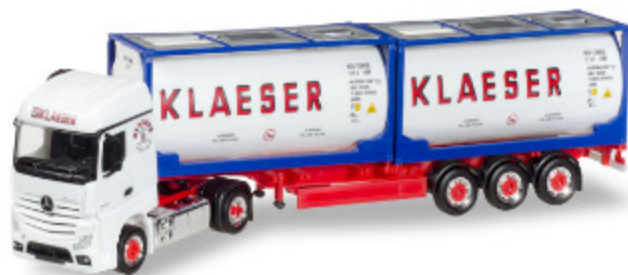
MB Actros Streamspace 2.5 Container-Sattelzug "Klaeser"